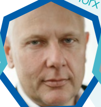
Matthias Horx